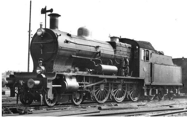
Locomotief serie NS 3700

Op Nienoord wordt hard gewerkt aan de aanleg van nieuwe sporen waarin ook de 10¼ inch spoorbreedte ligt (schaal 1:5,5). Daarbij past de introductie van nieuwe grotere en robuustere locomotieven. Daar wordt invulling aan gegeven met de bouw van de SS793 en de NS3744 . Met de bouw van deze replica's in de schaal 1:5,5 wordt er beoogt meteen ook een (cultuurhistorisch gezien) relevante aanvulling te realiseren op de nationale collectie historische railvoertuigen. De beide locomotieven worden zo exact mogelijk nagebouwd, op basis van originele tekeningen en uitgebreid historisch onderzoek. Het is de bedoeling dat de locomotieven in bruikleen komen bij SNSM.