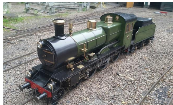
SNSM Locomotief No. 1, bouwjaar 1935