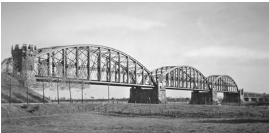
Spoorbrug bij Rhenen, 1873

Samen met Nienoord Spoorwegen heeft SNSM in 2021-2022 een spoorbrug gerealiseerd over de modelbotenvijver op het landgoed.