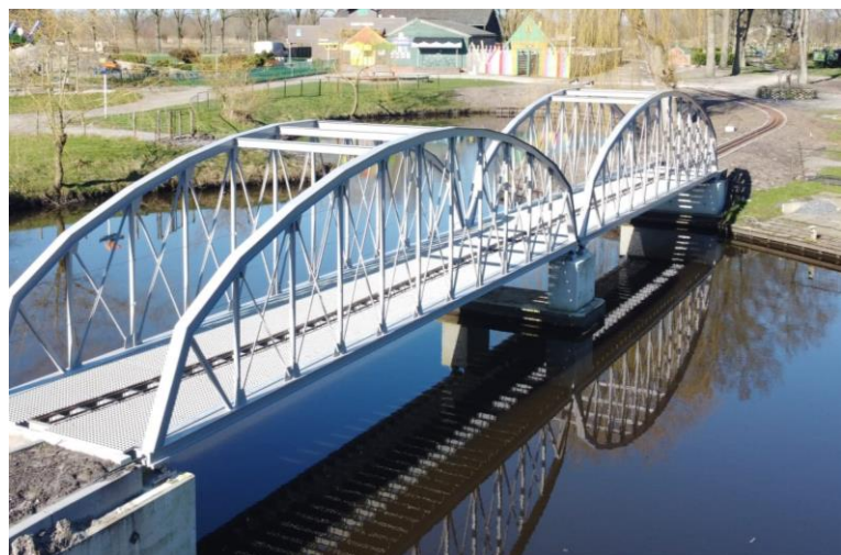
Spoorbrug SNSM in aanbouw 2022

De komende jaren is het de bedoeling om de landhoofden en pijlers van onze brug te voorzien van metselwerk bestaande uit passende materialen. Hiertoe is onderzoek gedaan naar de oorspronkelijke materialen en bouwwijze.